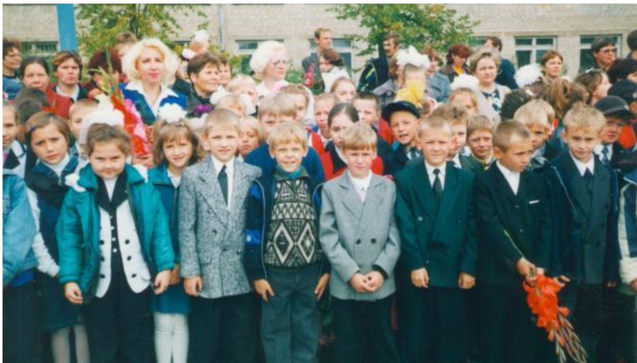
1 класс (01.09.1999г.)

Учитель, дни жизни своей, как один, Ты школьной семье посвящаешь, Ты всех, кто учиться к тебе приходил, Своими детьми называешь...