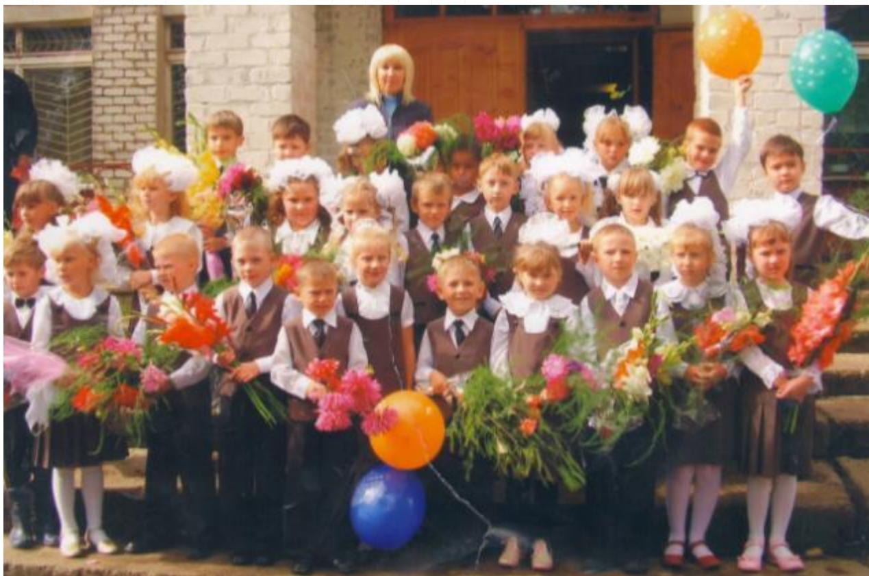
1 класс (01.09.2007г.)