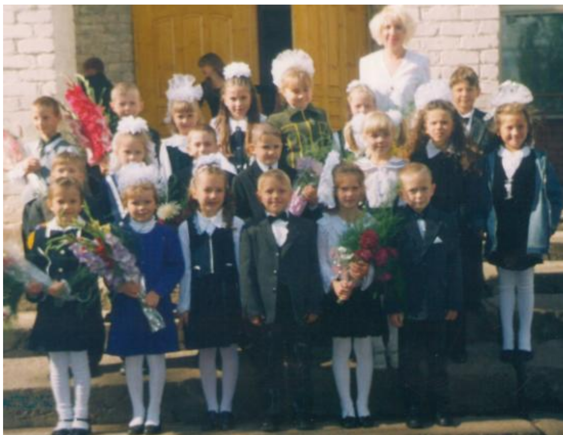
1 класс (01.09.2003г.)

Учитель, дни жизни своей, как один, Ты школьной семье посвящаешь, Ты всех, кто учиться к тебе приходил, Своими детьми называешь...