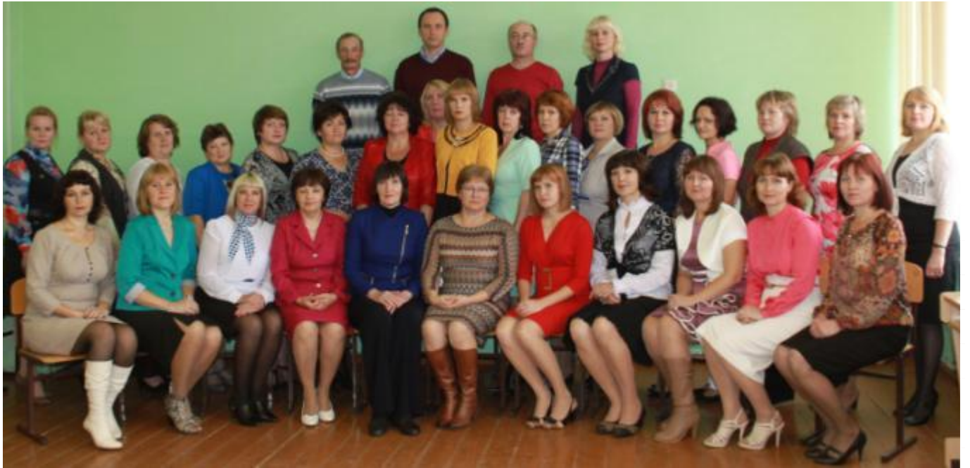
Педагогический коллектив МКОУ СОШ п.Фаленки