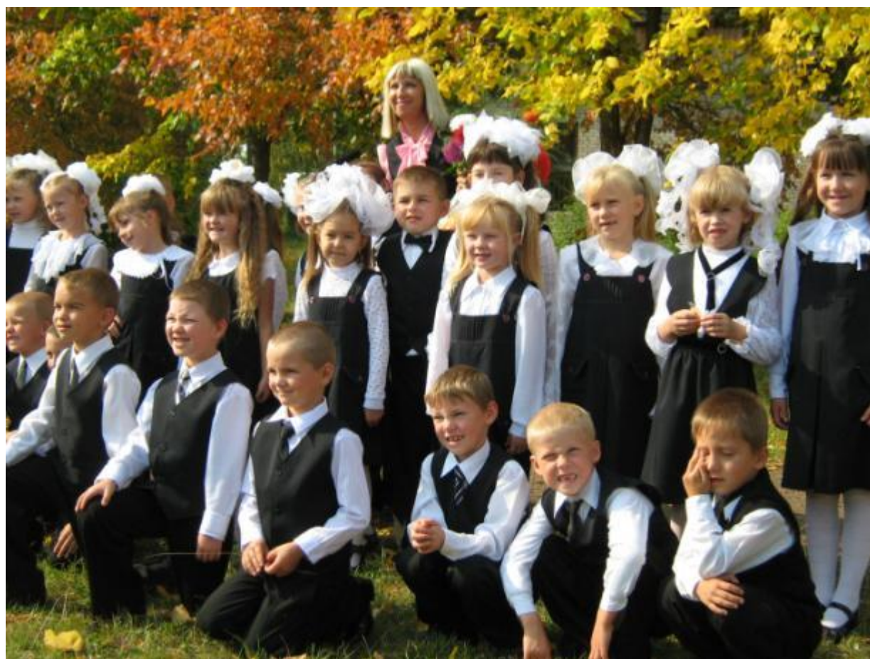
1 класс (01.09.2011г.)